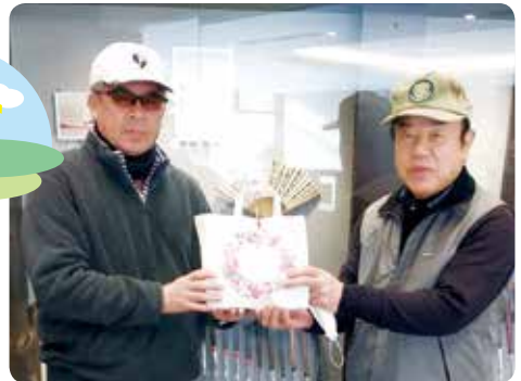
優勝商品をやっともらえました