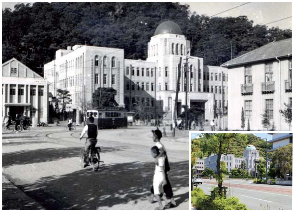
今昔写真館 『古きよき松山の風景と現在』 愛媛県庁前 昭和27年10月撮影