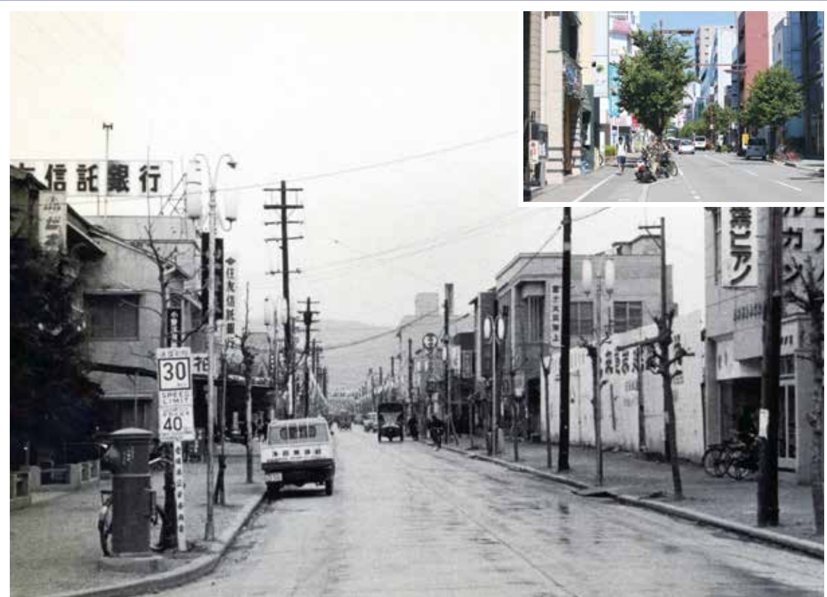
今昔写真館 『古きよき松山の風景と現在』 三番町4丁目 昭和34年2月撮影