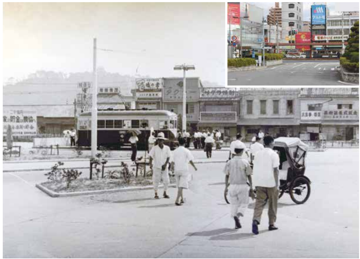
今昔写真館 『古きよき松山の風景と現在』 国鉄(JR)駅前 昭和29年9月撮影