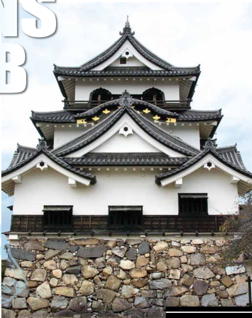
彦根城天守 (裏面に解説有)