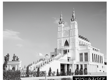
マリベールスパイア

人生をつなぐ。株式会社ベルモニー http://bellmony-west.jp 791-8012 愛媛県松山市姫原三丁目4-13 Tel.089-911-0980 Fax.089-922-9800