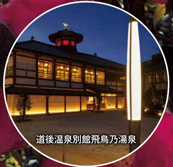
道後温泉別館飛鳥乃湯泉