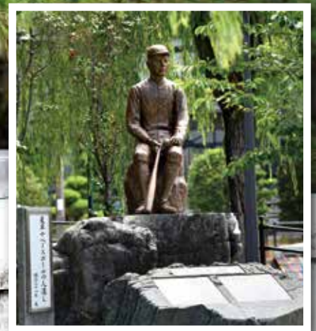
正岡子規像 道後 放生園